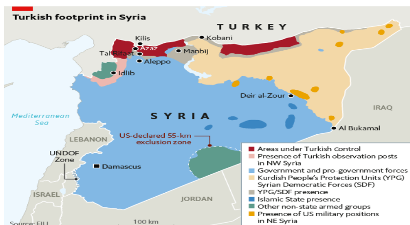
شکل ۳. پراکندگی جایگاه بازیگران داخلی در نقشه سوریه

واقعیت‌های متکثر سوریه جدید خواهد بود. به‌طور کلی؛ از دهه ۱۹۹۰ میلادی، قواعد بازی در مناطق ژئوپلیتیکی تغییر کرده و نقش قدرت‌های منطقه‌ای در محیط پیرامونشان بیشتر شده است، به‌گونه‌ای که؛ در آسیای غربی رقابت متداخل بین جمهوری اسلامی ایران، ترکیه و عربستان سعودی که هر یک داعیه رهبری بخشی از جغرافیای جهان اسلام را دارند، بیشتر نمایان شده است. از یک‌سو، جمهوری اسلامی ایران، اغلب مراکز جغرافیایی شیعه را حمایت می‌کند. اما؛ از سوی دیگر، عربستان داعیه رهبری جغرافیای اهل سنت را دارد. ترکیه نیز شکوه جغرافیای تاریخی خود را افتخار دانسته و در قرن کنونی به دنبال احیای قدرت نوینی به پهنای جغرافیای قدیم خود است. در حال حاضر این سه کشور در حال رقابت بر سر کسب برتری منطقه‌ای هستند. به این ترتیب، قدرت‌های منطقه‌ای در آسیای غربی به دنبال ترسیم استراتژی‌های متفاوتی هستند. به‌گونه‌ای که؛ عربستان سعودی تا پیش از تهاجم ایالات‌متحده آمریکا به عراق، خواهان «حفظ وضع موجود» در منطقه غرب آسیا بود؛ اما بعد از تغییر ساختار سیاسی در عراق، رویکرد تقابلی را در پیش گرفت. در حالی که؛ ج.ا.ایران، سیاست «تغییر جغرافیای قدرت» با تکیه بر کد ژئوپلیتیکی صدور انقلاب و حمایت از گروه‌های اسلام‌گرا در جغرافیای پیرامون را دنبال می‌کند. در این میان، رهبران ترکیه نیز سیاست توسعه نفوذ با استفاده از رویکرد قدرت نرم را در دستور کار خود قرار داده و در پی الگوی جدیدی بر اساس شکوه تاریخی عثمانی هستند. در واقع، نوع انگاره‌های این سه کشور که بر پایه عوامل ژئوپلیتیکی «قدرت، رقابت، نفوذ و کنترل جغرافیایی» شکل گرفته است، گاهی منجر به منازعات منطقه‌ای و نیابتی شده است (احمدی و حیدری موصولو، ۱۳۹۱: ۳۷۸).