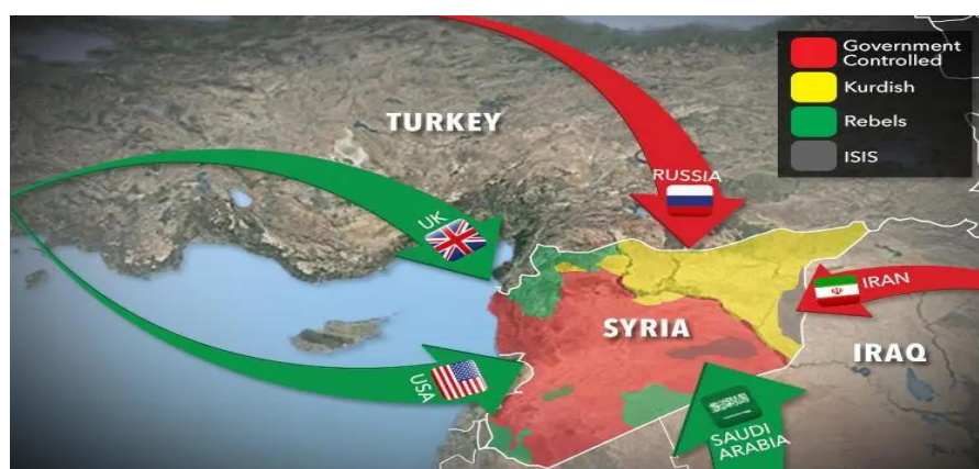
شکل ۲. وضعیت نفوذ بازیگران منطقه‌ای و جهانی در سوریه، منبع: (www.thesun.co.uk)