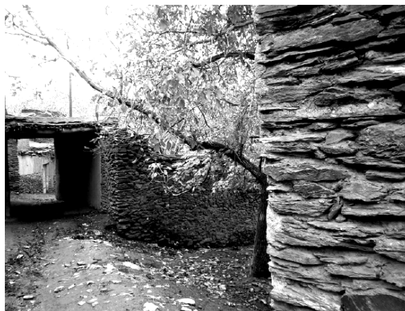
شکل ۵. تلفیق معماری و طبیعت در روستای ورکانه

این روستا به دلیل موقعیت جغرافیایی خاص آن، از دیرباز در انزوا قرار داشته است و تنها راه ارتباطی آن یک راه فرعی روستایی است. این انزوا گرچه محرومیت‌هایی را برای روستا به همراه داشته اما به اعتقاد نگارنده سبب حفظ فرم و فضای روستا به حالت سنتی خود شده است. به طور کلی در روستای ورکانه همچون دیگر روستاهای واقع در منطقه سردسیر زاگرس، به منظور استفاده از انرژی حرارتی ناشی از تابش آفتاب، پوشش سطوح خارجی تیره‌رنگ انتخاب گردیده و بافت روستا به هم فشرده است (قبادیان، ۱۳۸۳؛ عزیزی، ۱۳۷۵، ۲۸) (شکل ۶).