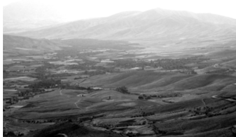
شکل ۸. دورنمای منظر متأثر از فرهنگ ساکنان (منظر فرهنگی) در روستای شهرستانه

شیارهای متعددی از دامنه‌های دره شهرستانه به عمق آن کشیده شده‌اند، که هریک دره‌ای سرسبز ایجاد کرده است. در دره شهرستانه، «خرم‌رود» جریان دارد و ارتفاعات بالادست مشرف به انتهای دره از زیستگاه‌های عمده پرنده‌گانی چون کبک محسوب می‌گردد (گروسین، ۱۳۸۳، ۱۲۳) (تصویر ۸). اهالی روستاهای دره شهرستانه عمدتاً به زراعت و باغداری می‌پردازند و خشکیار از جمله فرآورده‌های باغ‌های این دره است (بنیاد مسکن انقلاب اسلامی، ۱۳۸۶).