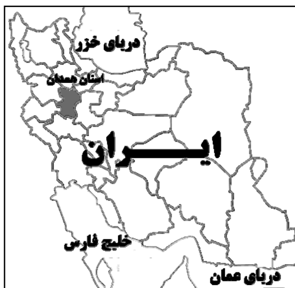
شکل ۲. موقعیت استان همدان در غرب کشور

دو روستای ورکانه و شهرستانه، در استان همدان و در دامنه رشته‌کوه زاگرس قرار گرفته‌اند. دلیل انتخاب این دو روستا برای انجام مطالعات موردی، وجود مشخصه‌های نسبتاً مشابه با کلیه روستاهای کوهپایه‌ای منطقه زاگرس بوده است (شکل‌های ۲ و ۳). در این مطالعه، در هریک از دو روستا، هشت عامل اصلی تأثیرگذار در شکل‌گیری منظر فرهنگی مورد توجه قرار گرفته و ارتباط آنها با فرهنگ و مدل زندگی روستاییان بررسی شده است. این عوامل که عبارت‌اند از اقلیم، آب، امنیت، نظام بهره‌برداری از زمین، ریخت‌شناسی (مورفولوژی) روستایی، مشاغل غالب مردم، طبیعت پیرامونی و سنت‌های اجتماعی، در جداول ۱ و ۲ ارائه گشته‌اند.