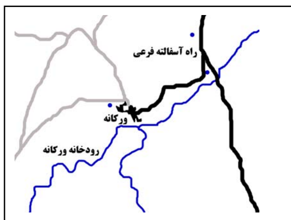
شکل ۴. موقعیت روستای ورکانه، با توجه به راه‌های فرعی و روستایی و منابع طبیعی پیرامون

روستای ورکانه در جنوب شرقی شهرستان همدان و در امتداد جاده فرعی منشعب از جاده همدان به ملایر قرار گرفته است (شکل ۴). این روستا به سبب بافت سنگی منحصر به فرد آن، در سال‌های اخیر مورد توجه قرار گرفته است. روستای مذکور همچنین به دلیل تلفیق هنرمندانه خانه‌ها، حیاط‌ها و باغ - خانه‌های سنگی با طبیعت پیرامون، دارای فضاهایی دلنشین و انسان‌مدار است (شکل ۵).