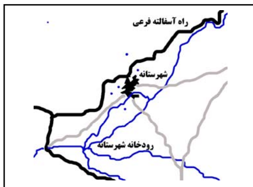
شکل ۷. موقعیت روستای شهرستانه، و راه‌های فرعی و روستایی و منابع طبیعی پیرامون

روستای شهرستانه در دره‌ای به همین نام واقع است (شکل ۷). دره شهرستانه از زمین‌های آبرفتی حوالی روستای اشتران آغاز می‌شود و در امتداد جاده قدیمی همدان به تویسرکان پس از گذر از چندین سکونتگاه روستایی در بلندترین ارتفاع منطقه به روستای شهرستانه ختم می‌گردد (بنیاد مسکن انقلاب اسلامی، ۱۳۸۶).