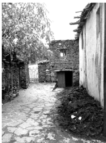
شکل ۹. شکل‌گیری منظر روستایی با مصالح بوم‌آورد به عنوان نشانه‌ای از تأثیر فرهنگ بر منظر