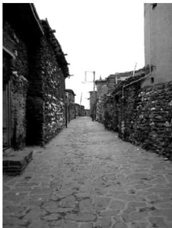
شکل ۶. معابر باریک و ساختمان‌های سنگی با سقف مسطح در بافت به هم فشرده روستای ورکانه.

براساس مشاهدات میدانی و بررسی نقشه‌ها و تصاویر ماهواره‌ای روستای ورکانه در طول دوره‌های مختلف زمانی، می‌توان مهم‌ترین عوامل مؤثر بر شکل‌گیری منظر فرهنگی در آن را در جدول ۱ طبقه‌بندی کرد و توصیفی کلی از آنها به دست داد (جدول ۱).