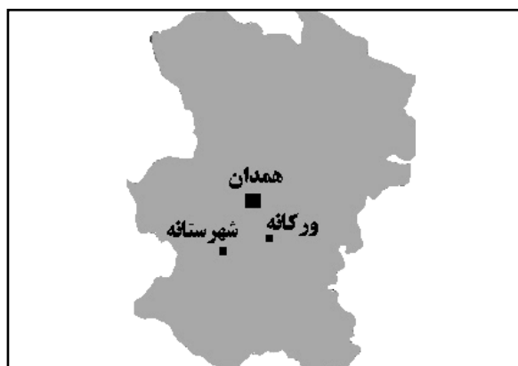
شکل ۳. موقعیت دو روستای ورکانه و شهرستانه در استان همدان منبع: نگارنده با اقتباس از نقشه‌های اولیه سازمان نقشه‌برداری کشور، ۱۳۸۶.