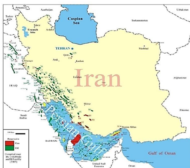
نقشه ۳. توزیع فضایی منابع تجدیدناپذیر نفت و گاز در فضای سرزمینی ایران

در این مرحله، رهیافت فوق را در منطقه مورد مطالعه تبیین می‌کنیم. عمده درآمدهای دولتی ایران، بر منابع تجدیدناپذیر از جمله نفت و گاز متکی است و از طرفی بیشتر منابع مزبور در حاشیه جنوب کشور واقع شده است (نقشه ۳). از طرفی، در ساختار نظام تقسیمات کشوری در این منطقه، بیشتر منابع مذکور در سه استان خوزستان، بوشهر و هرمزگان قرار گرفته‌اند. استان خوزستان به‌عنوان مهم‌ترین منطقه نفت‌خیز ایران، به‌تنهایی رقمی معادل ۴۶ درصد از میادین نفتی واقع در خشکی کشور را در اختیار دارد. در زمینه منابع گاز نیز خوزستان بیشترین میادین مستقل خشکی گاز طبیعی را در اختیار دارد، اما سهم استان بوشهر در تولید گاز بیشتر است؛ به‌گونه‌ای که این استان، با برخورداری از منابع گاز کنگان و نار، ۳۱/۳۱ درصد از گاز موجود اولیه و ۳۳/۸ درصد از ذخایر باقیمانده قابل‌استحصال کشور را در اختیار دارد (همان: ۱۲۴).