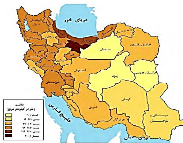
نقشه ۱. توزیع جغرافیایی جمعیت ایران برحسب تراکم در واحد سطح

نحوه تقسیم‌بندی واحدهای سیاسی و مرزبندی آن‌ها، ارتباط عمیقی با چگونگی توزیع و پراکنندگی جمعیت در محدوده آن‌ها دارد. در واقع، نحوه تقسیم‌بندی واحدهای سیاسی، به شکل‌گیری الگوی توزیع جمعیت در واحدها می‌انجامد. از طرفی، در رویکردهای توسعه منطقه‌ای، یکی از مهم‌ترین مؤلفه‌ها، توجه به مسائل کلی و هم‌پیوند توسعه، از جمله توزیع و پراکنش جمعیت و به تبع آن تعادل در نظام‌های سکونتگاهی مناطق هر کشور، به‌ویژه نواحی شهری آن است؛ برای مثال، شهرهای میانی در یک منطقه، نقش بارزی در برنامه‌ریزی برای دستیابی به توسعه پایدار منطقه‌ای ایفا می‌کنند. در نقشه جغرافیای جمعیت ایران، مسئله نبود تعادل فضایی جمعیت، در پهنه سرزمین ملی مشهود است. در مقیاس قلمرو جغرافیایی ایران، اگر با خطی فرضی از شمال به جنوب، ایران را به دو قسمت شرقی و غربی تقسیم کنیم، ۲۷/۳۴ درصد جمعیت در بخش شرقی و ۷۲/۶۵ درصد در بخش غربی زندگی می‌کنند. همچنین ۵۷/۳ درصد از جمعیت ایران، تنها در یک‌چهارم شمال غرب ایران متمرکز شده‌اند (اطاعت، ۱۳۹۰).