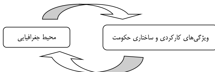
شکل ۱. رابطه متقابل ویژگی‌های محیط جغرافیایی و ساختار حکومت

به‌طور کلی، هر محیط جغرافیایی، نمادی از یک شیوه تفکر خاص یا بازتابی از یک ایدئولوژی خاص است. از این‌رو، در دهه‌های اخیر در تفسیر و تبیین پدیده‌ها و محیط‌های جغرافیایی، بر میزان قدرت، توان و به‌طور کلی، باورهای ایدئولوژیک و فلسفه سیاسی نظام حاکم تأکید شده و شناخت عقاید در کانون مباحث و تحلیل‌های جغرافیایی قرار گرفته است (شکوئی، ۱۳۸۴: ۴۸). به عبارت دیگر، پدیده‌های موجود در فضای جغرافیایی، از هر نوعی که باشند، بیانگر خصیصه‌های دینی، ایدئولوژیکی، فرهنگی، تاریخی و آرمانی ساختارها و نهادهای سیاسی حاکم بر آن‌ها هستند. از سوی دیگر، به‌گونه‌ای طبیعی، مقتضیات سرزمین و فضای جغرافیایی نیز در قالب ویژگی‌های طبیعی و زیستی و در چارچوب محدودیت‌ها و امکاناتی که در اختیار حکومت‌ها و افراد جامعه قرار می‌دهند، بر ویژگی‌های فرهنگی، سیاسی جامعه تأثیر می‌گذارند؛ برای نمونه، چگونگی توزیع منابع و مواهب زیستی در سطح یک کشور و به‌طور کلی مساعدت‌ها و ناملایمات اقلیمی، قطعاً بر نوع و شکل حکومت تأثیرگذار است؛ بنابراین، بررسی دقیق‌تر میزان تأثیر عوامل محیطی بر فلسفه‌های سیاسی - ایدئولوژیکی حکومت‌ها، تأثیرگذاری مستقیم عوامل محیطی بر ویژگی‌های حکومت‌ها و ساختارهای سیاسی را نشان می‌دهد. به‌طور کلی، گروهی از اندیشمندان در شکل‌گیری و گسترش ایدئولوژی‌ها، تمدن‌ها و فرهنگ‌ها و همچنین حوادث تاریخی، بر عوامل محیطی طبیعی و انسانی تأکید زیادی دارند.