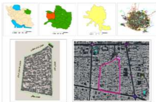
شکل ۳. محدوده محله سرده در شهر سبزوار. نقشه مبنا: کاربری اراضی شهر سبزوار (شهرداری سبزوار، ۱۳۹۰)

تقسیمات قدیمی شهر شامل کوی افتخارالحکما، کوی حمام آقا، خیابان بیهق شرقی، بازار بزرگ قدیم، و کوی قنبرسیاه است (محمدی، ۱۳۸۱: ۱۲۰). این محله از شمال به میدان فرمانداری (خیابان نواب صفوی)، از جنوب به خیابان بیهق، از شرق به خیابان قائم، و از غرب به خیابان فدائیان اسلام (شریعتمداری) ختم می‌شود. از نظر اجتماعی محله سرده جزو محلات متوسط‌نشین است و جمعیت آن به‌طور تخمینی در حدود ۲۵۰۰ نفر و مساحت آن ۹/۹ هکتار است. شکل ۳ موقعیت محدوده مورد مطالعه را نشان می‌دهد.