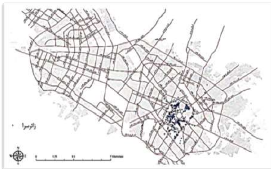
شکل ۲. نحوه پراکنش زائرسراهای اوقافی در سطح شهر مشهد

بر اساس اطلاعات اداره کل اوقاف خراسان رضوی، در حال حاضر تعداد زائرسراهای اوقافی این استان حدوداً ۲۹۵ مورد است. ۱ ملیت بیشتر مراجعه‌کنندگان ایرانی و از شهرهای مختلف ایران است، اما منحصراً زائرسراهایی برای افراد پاکستانی وجود دارد که تعداد آنها اندک است و اداره اوقاف استان نظارت آنها را بر عهده دارد. اسکان در این دسته از زائرسراها عمدتاً به صورت کاروان (گروهی) صورت می‌گیرد. ۸۰ درصد مراجعه‌کنندگان از نظر جنسیت مرد هستند. این زائرسراها فقط پذیرای میهمانان شیعه‌اند و از پذیرفتن افراد اهل تسنن و سایر مذاهب اجتناب می‌ورزند.