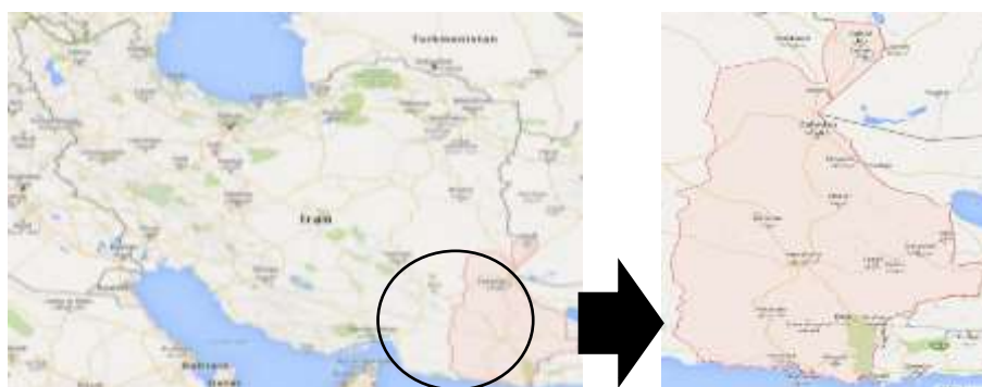
شکل ۳. موقعیت جغرافیایی استان سیستان و بلوچستان

مساحت استان ۱۸۷۵۰۲ کیلومتر مربع است که ۱۱٫۵ درصد از وسعت کشور را دربر می‌گیرد. این استان بین ۲۵ درجه و ۳ دقیقه تا ۳۱ درجه و ۲۹ دقیقه عرض شمالی و ۵۸ درجه و ۴۹ دقیقه تا ۶۳ درجه و ۲۰ دقیقه طول شرقی واقع شده است (گزارش اقتصادی، اجتماعی، و فرهنگی استان سیستان و بلوچستان، ۱۳۹۰: ۲). بر اساس آخرین تقسیمات کشوری این استان دارای ۱۴ شهرستان، ۳۷ مرکز شهری، ۴۰ بخش، ۱۰۲ دهستان، و ۹۲۳۶ آبادی کددار است (گزارش اقتصادی، اجتماعی، و فرهنگی استان سیستان و بلوچستان، ۱۳۹۰: ۲).