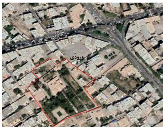
شکل ۵. تصویر ماهواره‌ای باغ موزه هرندی