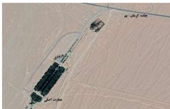
شکل ۴. تصویر ماهواره‌ای باغ شاهزاده ماهان

باغ شاهزاده ماهان (ثبت جهانی یونسکو) در شهرستان کرمان قرار دارد. شکل کلی باغ با محور مرکزی، آبشارها، پیاده‌روها، و ردیف متناوب درختان چنار و سرو، و کرت‌های جانبی میوه دید بیننده را به بنای سفید بالاخانه در متن کوه‌ها متوجه می‌سازد (نیلی و همکاران، ۱۳۹۲: ۱۷۳). درختان غالب این باغ سرو، چنار، و سپیدار است. از مهم‌ترین ویژگی‌های این باغ این است که به صورت پله‌ای ساخته شده است و باعث به‌وجود آمدن آبشارهایی در مسیر اصلی شده است. بنای این باغ به دوره قاجار نسبت داده می‌شود. نزدیکی به عمارت شتر گلو، آرامگاه شاه نعمت‌الله ولی، و خوش آب و هوا بودن منطقه از محاسن این باغ تاریخی محسوب می‌شود.