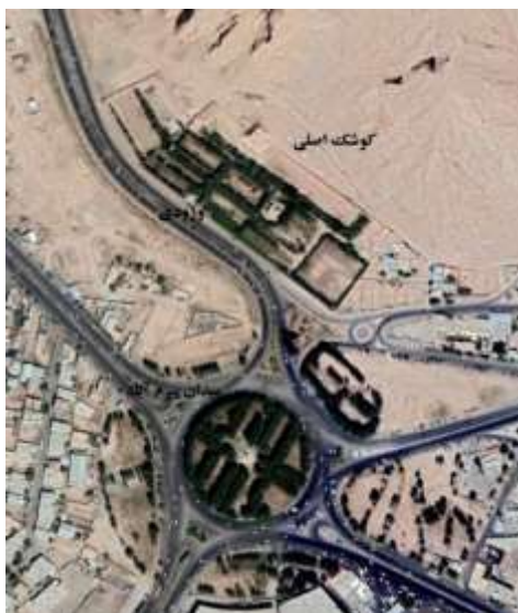
شکل ۷. تصویر ماهواره‌ای باغ بیرم‌آباد

قالب یک سیستم هندسی مبتنی بر دو محور متعامد مکان‌یابی شده‌اند. عمارتی که درارای دو اشکوب است و ما آن را عمارت اصلی می‌نامیم در انتهای محوری که ورودی نقطه آغاز آن است قرار گرفته و عمارتی که به دلیل پلان هشت‌ضلعی‌اش آن را گوشه هشت‌ضلعی می‌نامیم (سلطان‌زاده و اشرف گنجوی، ۱۳۹۲: ۸۰). نزدیکی به تخت درگاه قلی‌بیگ، گنبد جبلیه، و همچنین پارک جنگلی پردیسان بر اهمیت این باغ افزوده است.