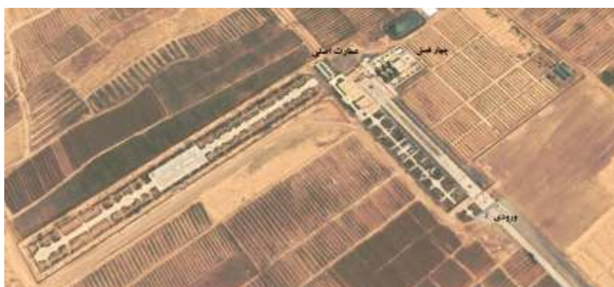
شکل ۶. تصویر ماهواره‌ای باغ فتح‌آباد کرمان