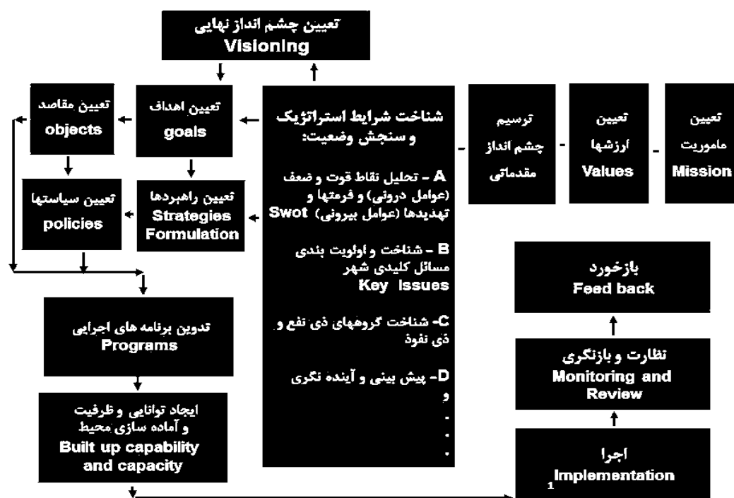
شکل ۱. فرایند کلی طرح راهبردی و جایگاه چشم‌انداز در آن؛ منبع: (سعیدی رضوانی، ۱۳۹۰)

برنامه‌های میان‌مدت پنج‌ساله معمولاً به سه صورت تهیه و تدوین می‌گردند؛ نوع اول این برنامه‌ها که به «برنامه‌های پروژه به پروژه» معروف می‌باشند، معمولاً در تجارب اول برنامه‌ریزی انجام می‌شوند. در این نوع برنامه‌ریزی، به دلیل فقدان اطلاعات، ابزار و تشکیلات سازمانی لازم، تنها به انتخاب تعدادی پروژه کلان مبادرت می‌شود و فرآیند برنامه‌ریزی که شامل تدوین و تنظیم اهداف، ارزیابی بازتاب‌های دستیابی به اهداف، انتخاب گزینه‌های اجرایی و ارزشیابی و اولویت‌بندی طرح‌ها و پروژه‌ها می‌باشد، صورت نمی‌گیرد. لذا در این نوع برنامه‌ریزی، اتلاف منابع و عدم موفقیت عملکردی پروژه‌ها به دلیل عدم اجرای طرح‌ها مکمل و متمم دور از انتظار نیست. نوع دوم برنامه‌ریزی‌های میان‌مدت، «برنامه‌ریزی یکپارچه سرمایه‌گذاری بخش عمومی» می‌باشد که به دلیل توجه به ارتباط میان طرح‌ها و پروژه‌ها، از کارایی بهتری برخوردار است. انتظار می‌رود که پس از اجرای چند برنامه از این نوع و تقویت توان تهیه و اجرای نهادهای برنامه‌ریزی، نوع سوم برنامه‌ریزی که تحت عنوان «برنامه‌ریزی جامع» نامیده می‌شود در دستور کار قرار گیرد. این نوع برنامه‌ریزی مستلزم مدل‌سازی و بهره‌گیری از داده‌های اطلاعاتی گسترده در ابعاد مختلف می‌باشد (شهرداری شیراز، ۱۳۹۲).