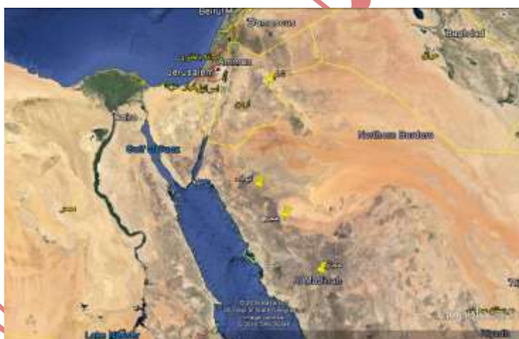
پیوست ۴- موقعیت طور سینا بین مصر و ایله. تهیه شده از google.earth