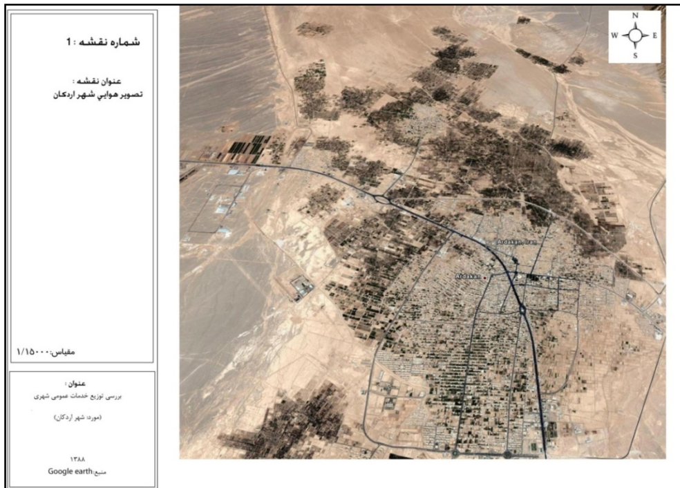
شکل ۱. تصویر هوایی شهر اردکان