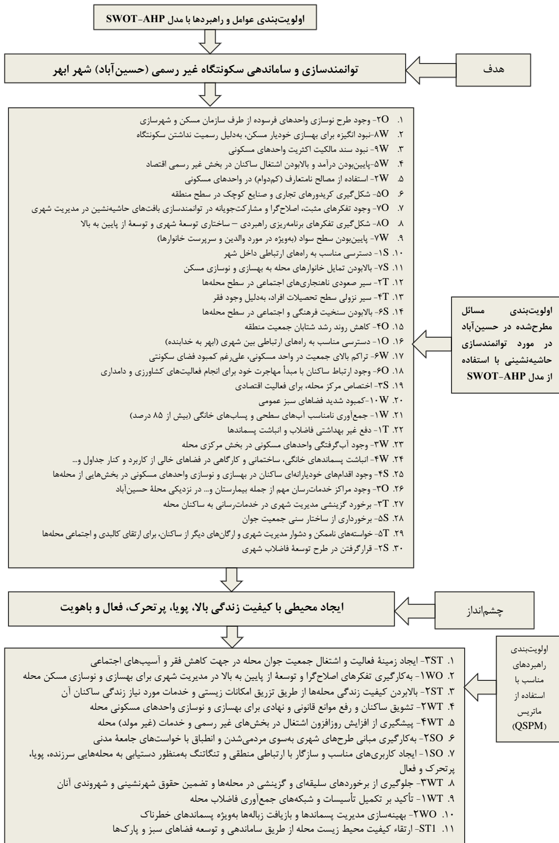
شکل ۲. اولویت‌بندی عوامل و راهبردها با مدل تلفیقی SWOT-AHP