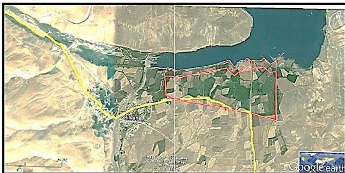
شکل ۳. منظره هوایی از دسترسی سایت

این سایت، دسترسی خشکی و آبی دارد. می‌توان با استفاده از قایق، از نواحی شرقی و غربی سایت به بخش آبی آن دسترسی داشت. در بخش خشکی، سایت براساس ساختار شبکه اصلی جاده‌ها شکل گرفته که از یک حلقه اصلی تشکیل شده است. حلقه اصلی به ورودی شهرک پیوند می‌خورد. این حلقه، در گوشه جنوب شرقی قرار گرفته است. برای تکمیل راه‌های ارتباطی، یک بلوار شمالی- جنوبی در مرکز شهرک، به‌عنوان محور اصلی برای ارائه خدمات و یک بلوار شرقی- غربی نیز برای دسترسی آسان‌تر، علاوه بر راه‌های فرعی در داخل سایت برای بازدیدکنندگان پیش‌بینی شده است.