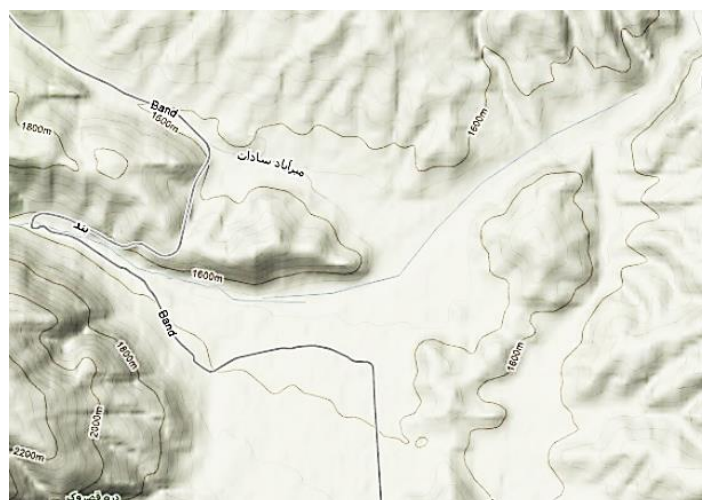
شکل ۲. وضعیت توپوگرافی ناحیه سیلوانا

شیب سایت سیلوانا بسیار مناسب و حدود ۶ درصد است. شکل اراضی سایت از نوع دشتی و اطراف آن توپوگرافی و حالت دانه‌لوبیایی است.