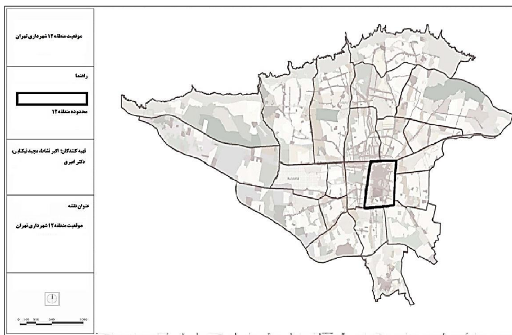
نقشه ۱. موقعیت قرارگیری منطقه ۱۲ شهرداری تهران

منطقه ۱۲ شهرداری تهران، با وسعت ۱۶۹۱ هکتار (۲/۳ درصد مساحت تهران) و جمعیت ۳۶۵ هزار نفر در سال ۱۳۹۰، بیش از سه‌چهارم تهران ناصری (مرکز تاریخی تهران) را پوشش می‌دهد. این منطقه از شمال به مناطق ۶ و ۷ (خیابان انقلاب)، از شرق به مناطق ۱۳ و ۱۴ (خیابان ۱۷ شهریور)، از جنوب به مناطق ۱۵ و ۱۶ (خیابان شوش) و از غرب به منطقه ۱۱ (خیابان حافظ و وحدت اسلامی) محدود می‌شود. براساس مطالعات طرح تفصیلی، بیش از ۳۴ درصد محدوده، از گستره‌ها و پهنه‌های شاخص و ارزشمند تشکیل شده است. علی‌رغم این ارزش‌ها، بیش از یک‌سوم سطح منطقه، فرسوده (اعم از ارزشمند یا غیر آن) محسوب می‌شود. به عبارت دیگر، مرکز تاریخی تهران در معرض زوال و تخریب روزافزون است (طرح تفصیلی منطقه ۱۲، ۱۳۸۶: ۷).