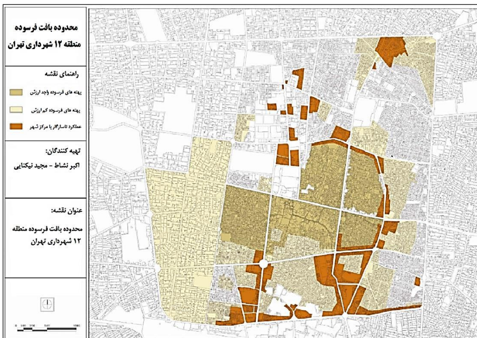
نقشه ۲. موقعیت پهنه‌های فرسوده منطقه ۱۲ شهرداری تهران