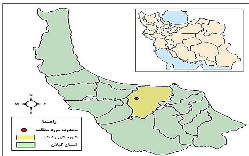
شکل ۱. نقشه موقعیت محدوده مورد مطالعه در تقسیمات سیاسی کشور و استان

محدوده مورد مطالعه شهر رشت از توابع استان گیلان در شمال ایران است که در ۴۹ درجه و ۳۶ دقیقه طول شرقی و ۳۷ درجه و ۱۶ دقیقه عرض شمالی واقع شده است. براساس سرشماری رسمی سال ۱۳۹۰، جمعیت این شهر ۹۵۱۶۳۹ نفر است و ۲۰۴۰۰۵۴ خانوار در آن ساکن هستند. محدوده استحفاظی براساس طرح جامع این شهر در سال ۱۳۸۶، ۱۶۰۱۸۸ هکتار است (مهندسان مشاور طرح کاوش، ۱۳۸۶: ۹) (شکل ۱).