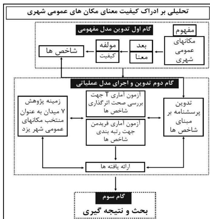
شکل ۱. فرایند پژوهش

هدف این پژوهش، شناسایی شاخص‌های اصلی دخیل در کیفیت معنای مکان‌های عمومی شهر یزد و اولویت‌بندی آنها از منظر شهروندان است. با توجه به این هدف، پرسش این است که شاخص‌های اصلی دخیل در کیفیت معنای مکان‌های عمومی شهر یزد و اولویت‌بندی آنها از منظر شهروندان کدام است؟ روش پژوهش در این مقاله، روش توصیفی-تحلیلی است. این پژوهش در مرحله گردآوری داده، از مطالعات اسنادی بهره برده و در مرحله تحلیل، با توجه به آمار استنباطی، با بهره‌گیری از روش‌های آماری به تحلیل پرسش‌های پرسشنامه پرداخته است. فرایند پژوهش به‌گونه‌ای تنظیم شده که با مروری بر پژوهش‌های پیشین، شاخص‌های کیفیت معنای مکان استخراج شده است و در مرحله بعد، با استفاده از پرسشنامه اهمیت شاخص‌های کیفیت معنا در میدان‌های منتخب از شهروندان پرسش شده است. در این مراحل، از روش پرسش‌گری و تحلیل کمی داده‌ها در محیط نرم‌افزار SPSS استفاده شده است. شکل ۱ فرایند پژوهش را نشان می‌دهد.