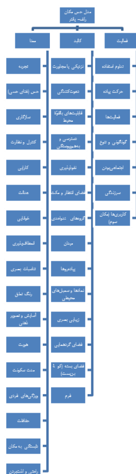
شکل ۱. مدل مفهومی طبقه‌بندی مؤلفه‌های تعاملات اجتماعی بر اساس مدل حس مکان رلف- پاتر