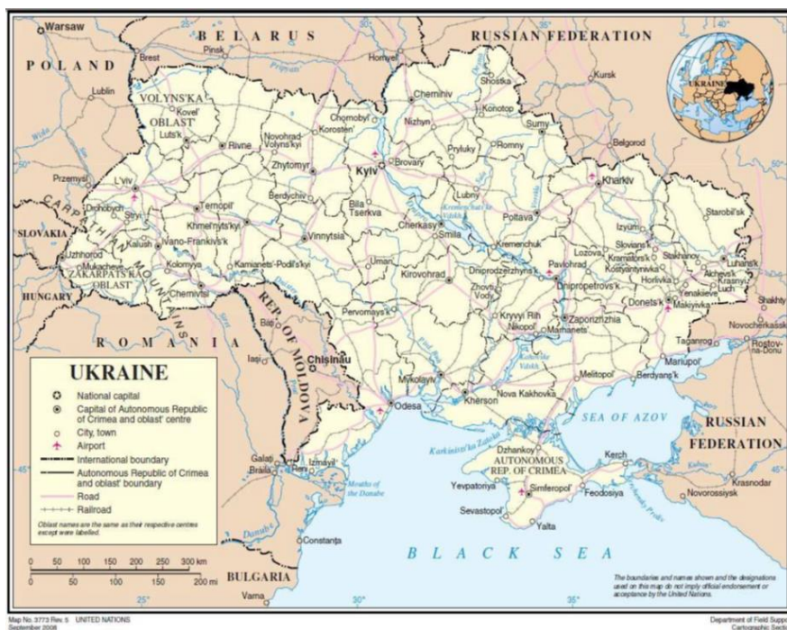
نقشه ۲. موقعیت ژئوپلیتیک اوکراین و شبه‌جزیره کریمه

اوکراین از نظر صنعتی و اقتصادی دومین جمهوری مهم شوروی سابق پس از روسیه به‌شمار می‌رود. به‌دلیل خاک حاصل‌خیز، کشاورزی اساس اقتصاد سنتی اوکراین را تشکیل می‌دهد. در قرن نوزدهم، اوکراین به‌دلیل صدور مقادیر زیادی از گندم به‌دست‌آمده از زمین‌های سیاهش به اروپا «سبد نان اروپا» شهرت داشت. بخش صنعت نیز در اوکراین سهم قابل توجهی از درآمدهای ناخالص داخلی این کشور را تشکیل می‌دهد. به‌طور کلی، بخش صنایع سنگین (فلزکاری، تولیدات شیمیایی، ساخت قطار، وسایل راه‌آهن، تراکتورسازی، و موتور ماشین) نسبت به سایر رشته‌های صنعت از تفوق فراوانی برخوردار است. در زمان اتحاد جماهیر شوروی، بخش مهمی از صنایع نظامی اتحادیه در اوکراین قرار داشت. مشهورترین کارخانهٔ موشک‌سازی در دنیپروپتروفسک ۱ قرار داشت که پنجاه‌هزار نفر در آن کار می‌کردند (صفری و وثوقی، ۱۳۹۵: ۱۱۸). با فروپاشی شوروی از تنش‌های سیاسی بین دو کشور همسایه- روسیه و اوکراین- کاسته نشد و در بسیاری از مسائل همچون افرادی که در کریمه هستند، تقسیم ناوگان شوروی در دریای سیاه، حق روسیه در استفاده از پایگاه دریایی سواستوپل، استفاده از امکانات نظامی در کریمه، و وضعیت پرسنل‌های نظامی روسیه در خاک اوکراین و ... این مناقشات وجود داشت (بیلر، ۲۰۱۵: ۹). از سال ۱۷۸۳ که شبه‌جزیرهٔ کریمه به‌عنوان مرکز خانات کریمه ضمیمهٔ خاک روسیه شد، روسیه ناوگان دریایی خود را در دریای سیاه و در بندر سواستوپل استقرار داد. این شهر در واقع به‌دلایل استراتژیکی و دسترسی به مسیرهای تجاری دریای سیاه، قفقاز، و روسیه، به روسیه اجازه می‌داد تا بتواند قدرت دریایی خود را در دریای مدیترانه گسترش دهد. بر همین اساس، اهمیت این پایگاه از سال ۲۰۰۸ برجسته‌تر شد (پائول، ۲۰۱۵).