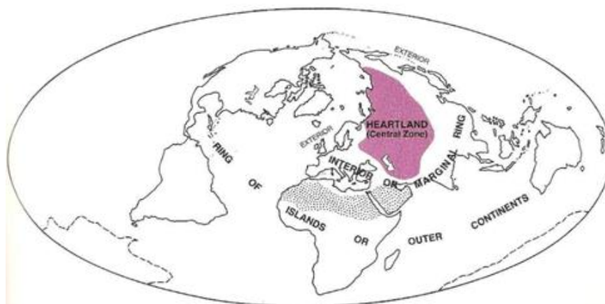
نقشه ۱. هارتلند مدنظر مکیندر

از نظر آلفرد ماهان، سرزمین نیم کره شمالی، که بخش‌های گسترده‌ای از آن از طریق گذرگاه‌های آبی دو کانال پاناما ۱ و سوئز ۲ به یکدیگر متصل‌اند، کلید قدرت جهانی‌اند و در داخل این نیمکره اوراسیا مهم‌ترین حوزه است. ماهان روسیه را به‌عنوان قدرت مسلط زمینی که مکان آن غیرقابل تهاجم است مورد تأیید قرار می‌داد. وی بر آن بود که منطقه حیاتی منازعه میان عرض‌های جغرافیایی ۳۰ و ۴۰ قرار دارد؛ جایی که قدرت زمینی روسیه و نیروی دریایی بریتانیا به یکدیگر می‌رسند (کوهن، ۱۳۸۷: ۵۰).