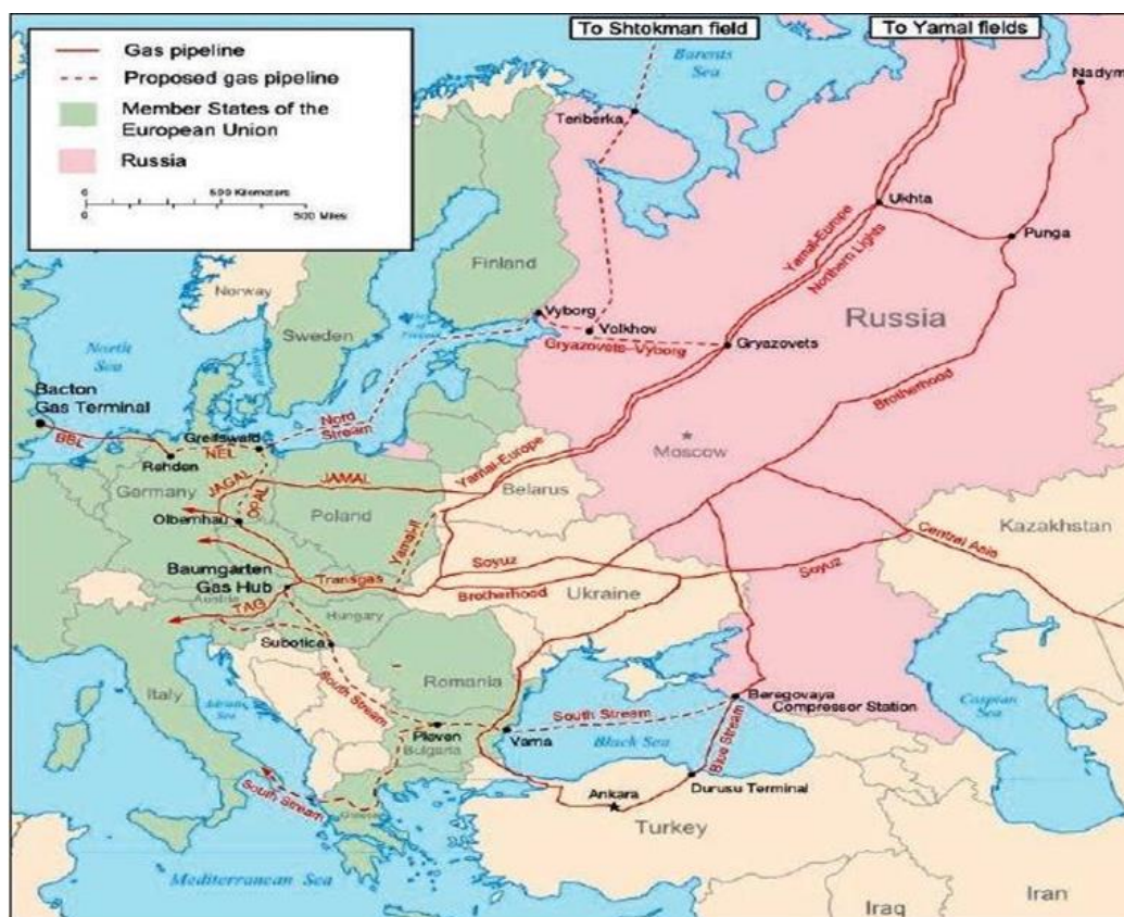
نقشه ۳. جایگاه اوکراین در انتقال انرژی از روسیه به اتحادیه اروپا