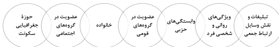
شکل ۱. عوامل مؤثر بر رفتار انتخاباتی

در میان مراحل جدایی‌گزینی، مهاجرت گروه‌های انسانی و اسکان آن‌ها در محله‌های خاص فضاهای شهری به‌عنوان مرحله بنیادین جدایی‌گزینی اکولوژیکی قابل تبیین است. مهاجران، با هجوم به شهر یا محله مقصد، باعث تقویت گروه‌های هم‌نژادی، قومی، و اقتصادی می‌شوند و از این طریق بر همگرایی، اعتماد، توسعه، و تنوع اکولوژیکی شهر یا برعکس واگرایی، اختلاف، برخورد، و عقب‌ماندگی شهر و محله تأثیر می‌گذارند (حاجی‌نژاد و همکاران، ۱۳۹۴: ۳۷). مهاجران با کسب اطلاعات اولیه درباره شهر مقصد محل سکونت خود را براساس الگوی متناسب با اوضاع اجتماعی و اقتصادی خود برمی‌گزینند. این مکان‌گزینی ممکن است متأثر از علقه‌های قومی و نژادی باشد که به این ترتیب باعث تقویت گتوهای کوچک یا بزرگ قومی یا نژادی می‌شود (مرصوصی و همکاران، ۱۳۸۸: ۷۷) و نتیجه آن تشدید جدایی‌گزینی فضایی و اکولوژیکی در شهرهاست (حاجی‌نژاد و همکاران، ۱۳۹۴: ۳۷). در این میان، شناسایی پیامدها و اثرهای این جدایی‌گزینی بر محیط‌های شهری و رفتارهای شهروندان بسیار مهم است (اعظم‌آزاده، ۱۳۸۳: ۲۶). رفتار انتخاباتی، به‌مثابه نوعی کنش سیاسی، عبارت است از کنشی که مردم در انتخابات و رأی‌دادن انتخاباتی با تأثیرپذیری از عوامل مختلف از خود نشان می‌دهند (قجری و همکاران، ۱۳۹۰: ۱۴۱). در بررسی الگوهای رفتارهای انتخاباتی دیدگاه‌های متفاوتی وجود دارد؛ آنچه از مجموع آرا و دیدگاه‌ها برمی‌آید این است که عوامل مختلف و متفاوتی توأمان در رفتار رأی‌دهی افراد مؤثرند. برخی عوامل مؤثر در رفتار انتخاباتی افراد در شکل ۱ آمده است.