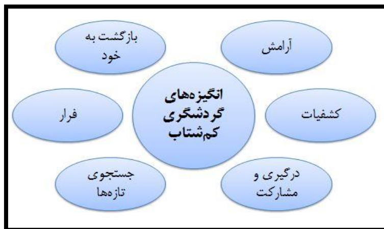
شکل ۱. انگیزه‌های گردشگران برای سفر کم‌شتاب

ارزیابی ژئومورفوسایت‌ها موضوعی است که انگیزه و علاقه جغرافی‌دانان سراسر دنیا را به تلاش برای تمرکز بر توسعه و حفظ روش‌های ارزیابی نشان می‌دهد؛ روش‌هایی ارزیابی که در گذشته عرضه کرده‌اند. این روش‌ها در تلاش برای شناسایی سایت‌ها و مکان‌های مستعد برای توسعه ژئوتوریسم و برنامه‌ریزی گردشگری و همچنین شناسایی مکان‌هایی‌اند که حفاظت از آنها ضروری می‌نماید (سلمانی و فرجی سبکیار، ۱۳۹۴: ۱۷۸). در چند دهه اخیر، روش‌های مختلفی برای ارزیابی ژئومورفوسایت‌ها معرفی شده که در آنها معیارها و ارزش‌های مختلفی برای ارزیابی توانمندی‌های ژئوتوریسم مناطق تعیین شده است. هر روش به کمک کارشناسان مختلف ژئوتوریسم و علوم زمین بررسی و ارزشیابی شد و پس از طی مراحل مختلف، در نهایت به‌مثابه روش ارزیابی معرفی شد (همان: ۱۷۹). در جدول ۱ می‌توان مهم‌ترین پژوهش‌ها در زمینه ارزیابی ژئومورفوسایت‌ها را مشاهده کرد.