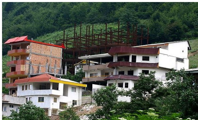
تصویر ۲. نمایی از ساخت و ساز در محدوده منابع طبیعی منطقه دماوند