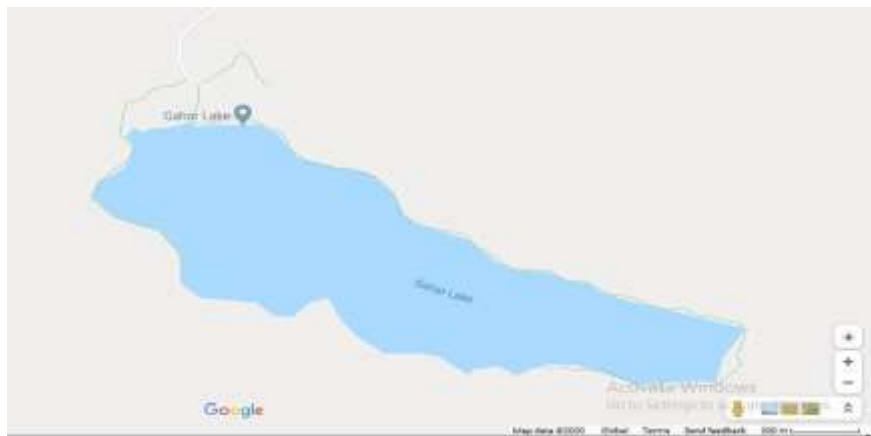
شکل ۱. نقشه دریاچه گهر

ایران از جاذبه‌های طبیعی گردشگری فراوانی برخوردار است که از آن جمله دریاچه گهر است. دریاچه گهر دریاچه‌ای کوهستانی است که در میان رشته کوه اشتران کوه استان لرستان با ارتفاع ۲۳۵۰ متر از سطح دریا واقع شده است و حدود ۱۷۰۰ متر درازا و ۴۰۰ تا ۸۰۰ متر پهنا و ۴ تا ۲۸ متر ژرفا دارد. این دریاچه در منطقه حفاظت‌شده اشتران کوه شهرستان دورود قرار دارد که به نگین اشتران کوه معروف است و به علت نداشتن راه ماشین‌رو منطقه بکری است و تا حد زیادی در امان مانده است از گزند انسان. سالانه حدود ۷۰.۰۰۰ گردشگر از این منطقه بازدید می‌کنند. مسیر اصلی دریاچه از شهرستان دورود شروع می‌شود و پس از طی مسافت حدود ۱۸ کیلومتر به انتهای آسفالت‌شده جاده می‌رسد. از این نقطه تا رسیدن به دریاچه گهر حدود پنج ساعت پیاده‌روی لازم است (سایت دریاچه گهر، ۱۳۹۸).