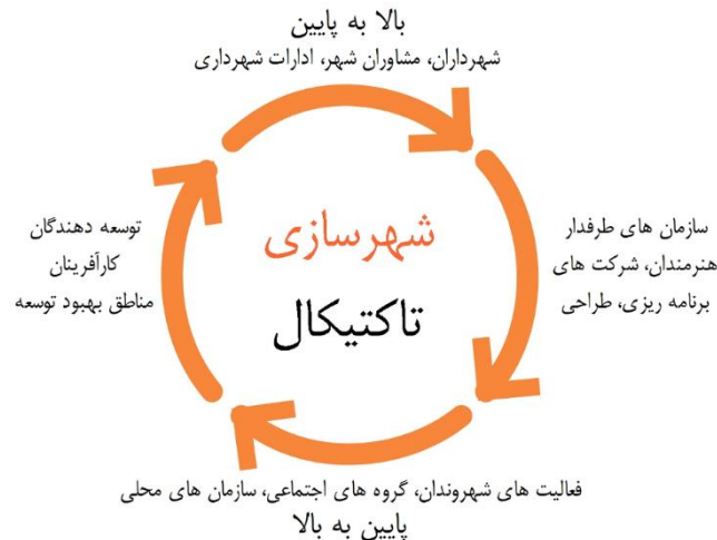
شکل شماره ۱. اصول و ابعاد شهرسازی تاکتیkal

شهرسازی مبتنی بر تحولات ساختاری- کارکردی یک مفهوم کلی است که برای توصیف مجموعه‌ای از تغییرات موقت و کم‌هزینه در محیط ساخته شده استفاده می‌شود. این تغییرات عموماً در شهرها انجام می‌شود و هدف آن بهبود وضعیت محلات و مکان‌های عمومی است. از شهرسازی تاکتیkal با عناوین دیگری نظیر شهرسازی پاپ آپ، شهرسازی چریکی (نامنظم و آموزش ندیده)، تعمیر شهری، یا شهرسازی «خودت انجامش بده» ۱ یاد می‌شود (دیجی، ۱۳۹۰: ۴۲). به عبارتی دیگر، رویکرد تاکتیkal شامل انواع شیوه‌های ابتکاری است و استراتژی‌ها و پتانسیل طراحی شهری با استفاده از تأسیسات و امکانات موقت را بررسی می‌کند. برخی از این شیوه‌ها چند ساعت طول می‌کشد. در حالی که برخی از آن‌ها می‌توانند برای مطالعات گسترده‌ای که ممکن است تا یک سال ادامه یابند استفاده شوند. به‌طور کلی شهرسازی تاکتیkal را می‌توان رهیافت نوینی تعریف کرد که پایه و اساس آن مشارکت مردم است و استفاده از پروژه‌های کوتاه‌مدت و زودبازده از ویژگی‌های مهم آن است. شهرسازی تاکتیکی نیاز به در نظر گرفتن بعضی از اصول طراحی دارد تا بتواند فضاهای عمومی پُرجنب‌وجوش و پویا را ایجاد کند (اسمیت و همکاران، ۱۳۹۴ به نقل از زارع و همکاران، ۱۳۹۸: ۱۳۸).