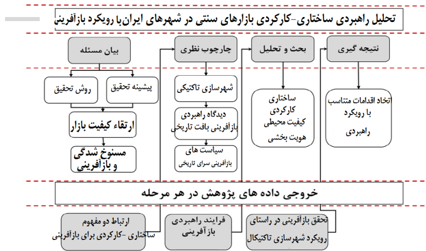
شکل شماره ۲. چارچوب مفهومی تحقیق

شهرسازی مبتنی بر تحولات ساختاری- کارکردی یک مفهوم کلی است که برای توصیف مجموعه‌ای از تغییرات موقت و کم‌هزینه در محیط ساخته شده استفاده می‌شود. این تغییرات عموماً در شهرها انجام می‌شود و هدف آن بهبود وضعیت محلات و مکان‌های عمومی است. از شهرسازی تاکتیkal با عناوین دیگری نظیر شهرسازی پاپ آپ، شهرسازی چریکی (نامنظم و آموزش ندیده)، تعمیر شهری، یا شهرسازی «خودت انجامش بده» ۱ یاد می‌شود (دیجی، ۱۳۹۰: ۴۲). به عبارتی دیگر، رویکرد تاکتیkal شامل انواع شیوه‌های ابتکاری است و استراتژی‌ها و پتانسیل طراحی شهری با استفاده از تأسیسات و امکانات موقت را بررسی می‌کند. برخی از این شیوه‌ها چند ساعت طول می‌کشد. در حالی که برخی از آن‌ها می‌توانند برای مطالعات گسترده‌ای که ممکن است تا یک سال ادامه یابند استفاده شوند. به‌طور کلی شهرسازی تاکتیkal را می‌توان رهیافت نوینی تعریف کرد که پایه و اساس آن مشارکت مردم است و استفاده از پروژه‌های کوتاه‌مدت و زودبازده از ویژگی‌های مهم آن است. شهرسازی تاکتیکی نیاز به در نظر گرفتن بعضی از اصول طراحی دارد تا بتواند فضاهای عمومی پُرجنب‌وجوش و پویا را ایجاد کند (اسمیت و همکاران، ۱۳۹۴ به نقل از زارع و همکاران، ۱۳۹۸: ۱۳۸).