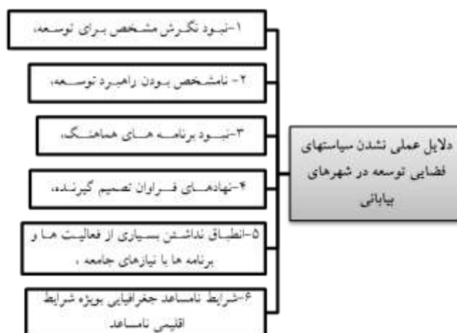
شکل ۳. دلایل عملی نشدن سیاست‌های فضایی توسعه در شهرهای بیابانی و کویری (کامران و حسینی، ۱۳۹۸)

مختلف) خیلی ارزان‌تر از بخش‌های مرکزی شهر و متن اصلی شهر است (زنگنه و همکاران، ۱۳۹۱: ۱۸۸). با این حال، توسعه‌های شهری که بیشتر مساحت آن‌ها کویری و بیابانی است به دلایل گوناگون با مشکل روبه‌روست.