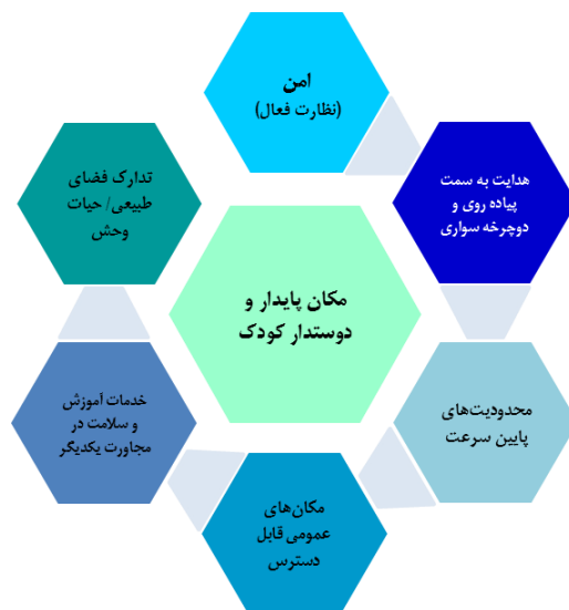
شکل ۱. مشخصه‌های شهر پایدار دوستدار کودک

می‌شود: طرد اجتماعی؛ انگ زدگی و بدنامی؛ خشونت و جرم؛ نبود زمینه‌های فعالیت متنوع؛ محیط ملال‌آور؛ پسماند؛ عدم تدارک نیازهای پایه‌ای؛ نبود امنیت حق تصرف و بی‌قدرتی سیاسی (گیلبرت، ۱۳: ۲۰۱۶). در ادامه به مهم‌ترین مؤلفه‌های برنامه‌ریزی برای کودکان پرداخته می‌شود.