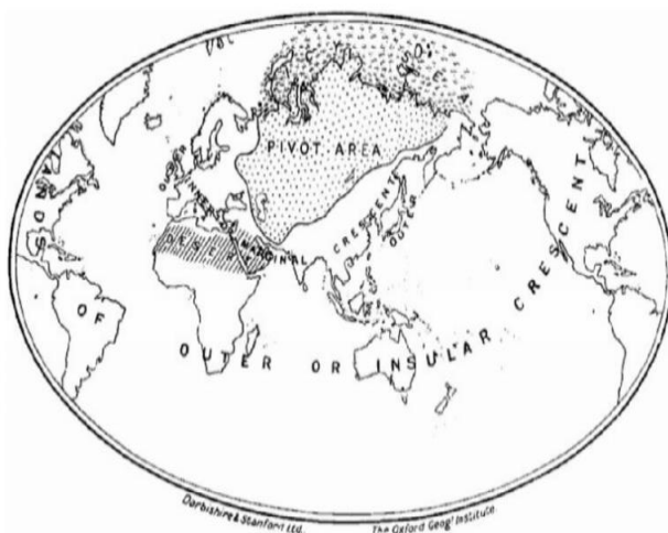
شکل شماره ۱. جهان مکیندر، منبع: (مکیندر، ۱۹۰۴: ۴۳۵)

اصطلاح در کتاب جغرافیا و قدرت جهانی استفاده کرد (فرگریو، ۱۹۱۵)، مکیندر این اصطلاح را در قالب یک نظریه نظام‌مند به کار گرفت. نگرانی او حفظ برتری سیاسی، تجاری و صنعتی امپراتوری بریتانیا در زمانی بود که فرماندهی دریاها دیگر تضمین‌کننده برتری جهانی نبود. مکیندر ظهور کشورهای بری اوراسیایی را بزرگ‌ترین تهدید برای هژمونی جهانی بریتانیا دانست (کوهن، ۲۰۱۴: ۱۷). وی با اصالت دادن به قدرت بری در سال ۱۹۱۹ عنوان داشت که هر کس بر اروپای شرقی تسلط یابد بر هارتلند نیز مسلط خواهد شد، هر کس بر هارتلند مسلط شود بر جزیره جهانی مسلط خواهد شد و هر کس بر جزیره جهانی مسلط شود بر جهان مسلط می‌شود (بالسیجر، ۲۰۱۸: ۱۲). مکیندر نگران افزایش قدرت امپراتوری آلمان در قاره اروپا در برابر بریتانیا بود (اتوتایل و همکاران، ۱۹۹۸: ۱۶؛ هاجپرگ و اسلوان، ۲۰۱۷: ۸). نظریه هارتلند وی بر لزوم ایجاد "مناطق حائل" بین روسیه و آلمان تأکید می‌کرد؛ این یک رویکرد ژئواستراتژیکی بود که بر سیاست‌های قرن بیستم تأثیر می‌گذاشت (بالسیجر، ۲۰۱۸: ۱۲). این تئوری و تئوری پرداز آن امروزه نیز اهمیت خود را از دست نداده است و عرصه سیاست بین‌الملل شاهد بازسازی تفکرات مکیندر بوده است که با افزایش مجدد علاقه به ژئوپلیتیک و هارتلند همراه بوده است (هیوز و هلی، ۲۰۱۵: ۹۰۱). نویسندگان استدلال می‌کنند که شناسایی و توصیف هارتلندها در ژئوپلیتیک معاصر، به‌عنوان یک‌راه مفید برای درک قدرت پویایی ژئوپلیتیک است. بنابراین ما ایده خود را در زمینه «ایران، هارتلند کریدوری جهان» در پس‌زمینه یک نظریه بزرگ ژئوپلیتیک که می‌تواند در قرن جدید پویایی خود را نشان دهد، ارائه می‌دهیم.