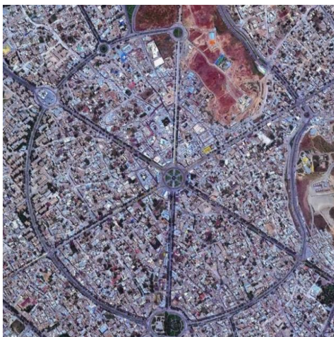
شکل ۱. تصویر هوایی تپه هگمتانه و موقعیت آن نسبت به میدان مرکزی شهر همدان