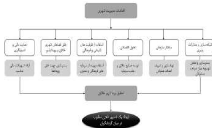
شکل ۱. مدل مفهومی مبانی نظری پژوهش