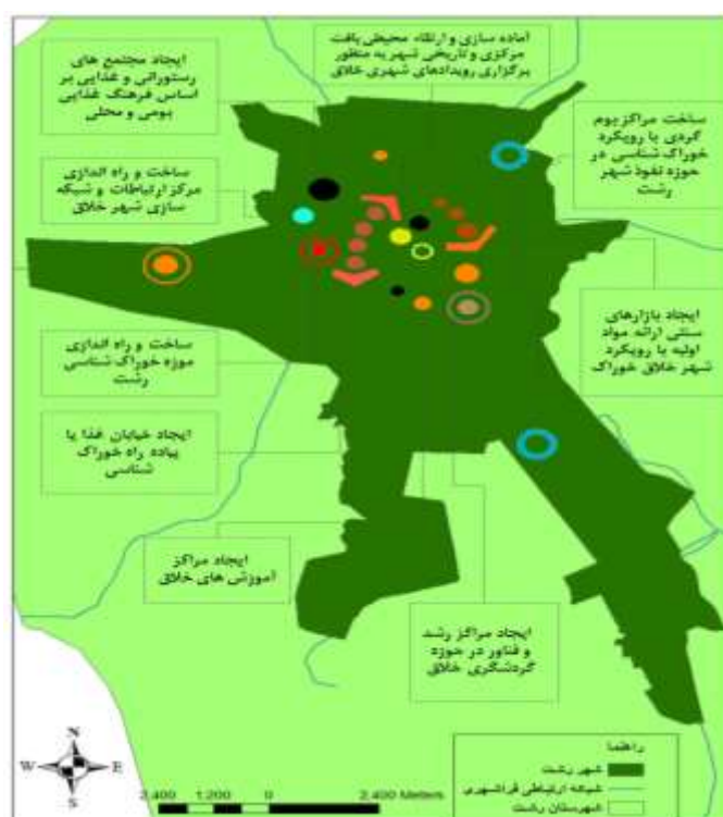
شکل ۴. نقشه مفهومی پیشنهادی